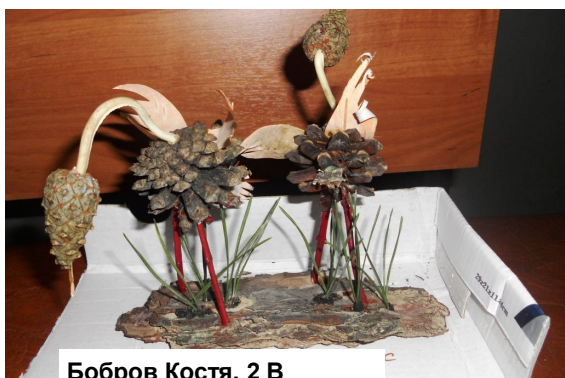
Бобров Костя, 2 В