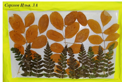
Сергеев Илья, 3А

Моя мама—учительница, а это значит, что мне повезло, ведь мы с мамой помогаем друг другу. Мама мне—с уроками (алгеброй), а я ей—по дому. Хотя моя мама и учитель английского языка, но делать задания по английскому она мне сейчас не помогает, правда, со 2 по 6 класс мы изучали язык по дополнительным учебникам почти каждый день. На каникулах это выглядело мучительно. Мы с мамой вместе ездим в школу на велосипедах, а зимой ходим пешком. Зимой по дороге мы часто играем в слова и «Угадай мелодию». Я могу пользоваться мамным кабинетом, делать там уроки, пока я жду тренировку. Дома мама почти каждый день допоздна сидит за компьютером—печатает газету, готовится к занятиям. Поэтому мне редко удается поиграть в компьютер. Мы с папой часто помогаем маме чинить и красить класс, перевозим цветы на лето домой, а осенью—в класс.